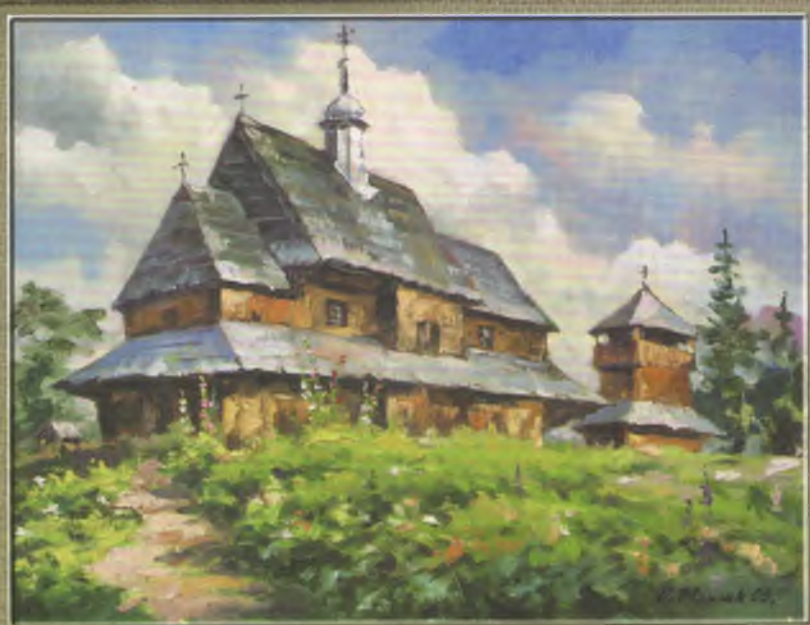
Манюк Орест Церква у Мединічах. Полотно, олія. 50x65