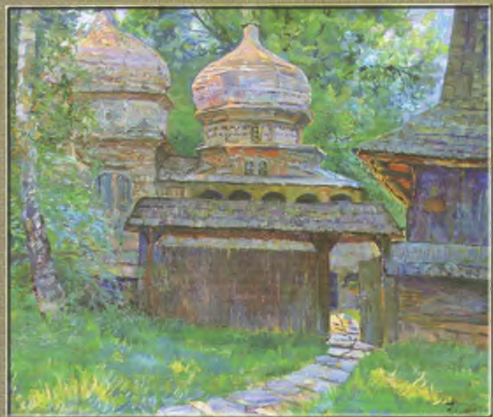
Дубровський Олександр Церква святого Юра Полотно, олія, 70x80