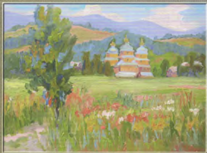
Косар Орест Квітуча полонина Полотно, олія, 45,5x60