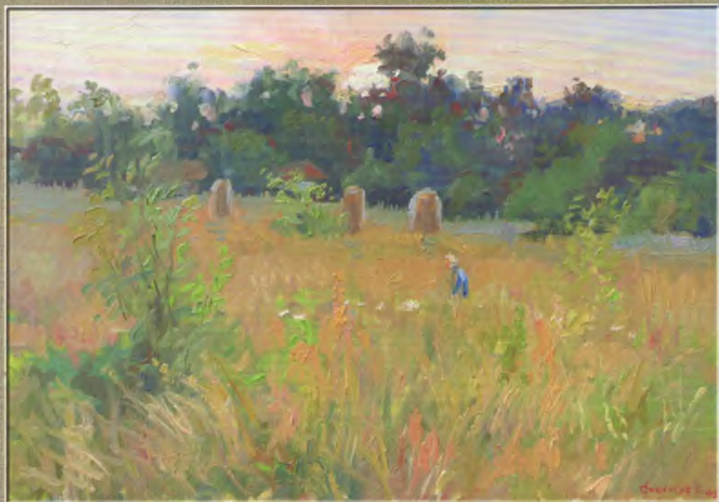
Стогнут Віктор Сонце сідае Полотно, олія. 50X70