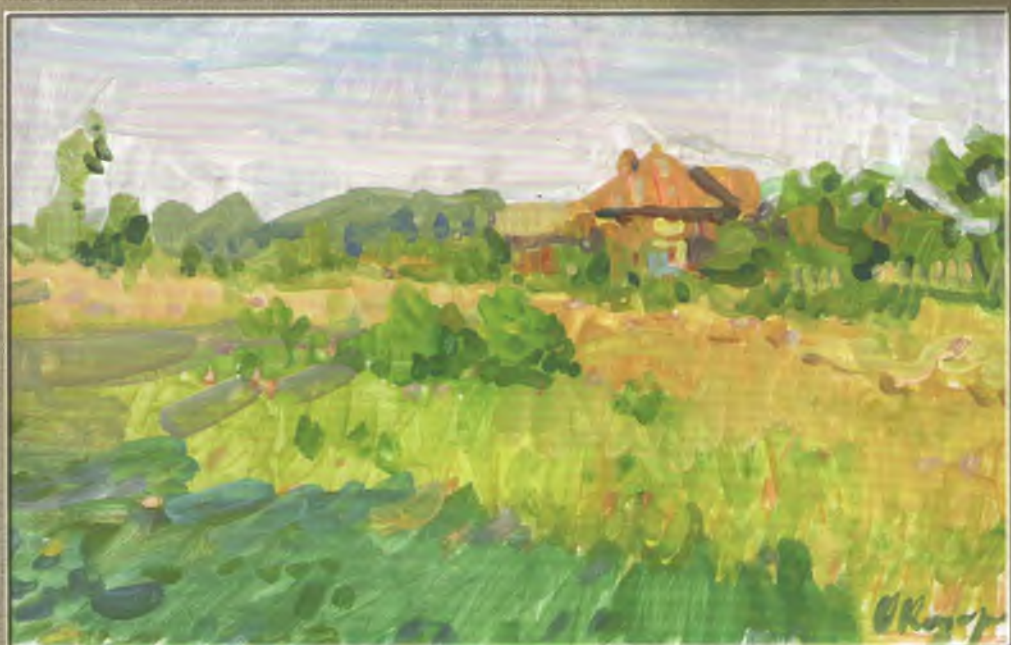
Коцарев Олександр Теплий вечір у Ведмежому Картон, олія. 30x45