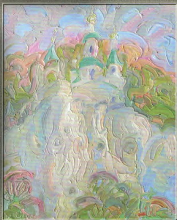
Вінник-Штеп О.Л. 2007. П. о. 57x12. Святогірськ. Верхня церква. Надвечір.