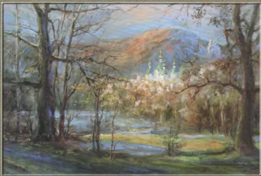
Шандиба В.В. Осень у Святогірську, 2007. П., о. 50x70