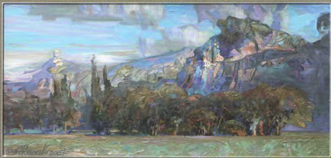
Різниченко О.В. Святогірська архіка. 2007 К. о. 51x36