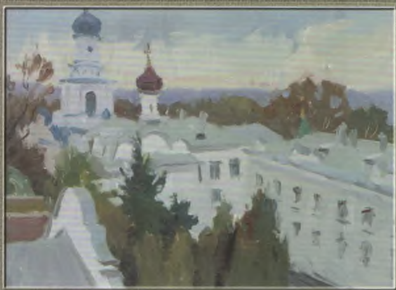
Заліщук В.В. Святогірська Лавра. Похмурий день. 2007. К., о. 30x44