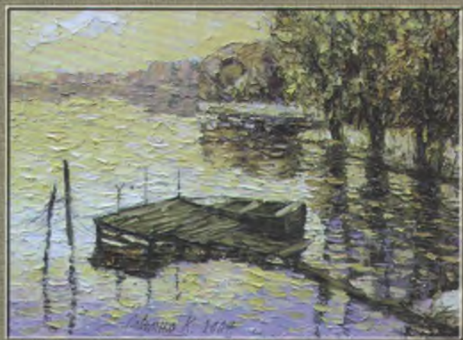
Савченко К.Ю. Вечір, 2007. П., о. 60x80