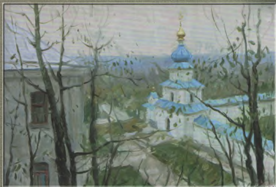
Коцарев О.В. Святогірськ. Церква Св. Антонія і Феодосія. 2007. П. на к., о. 30x40