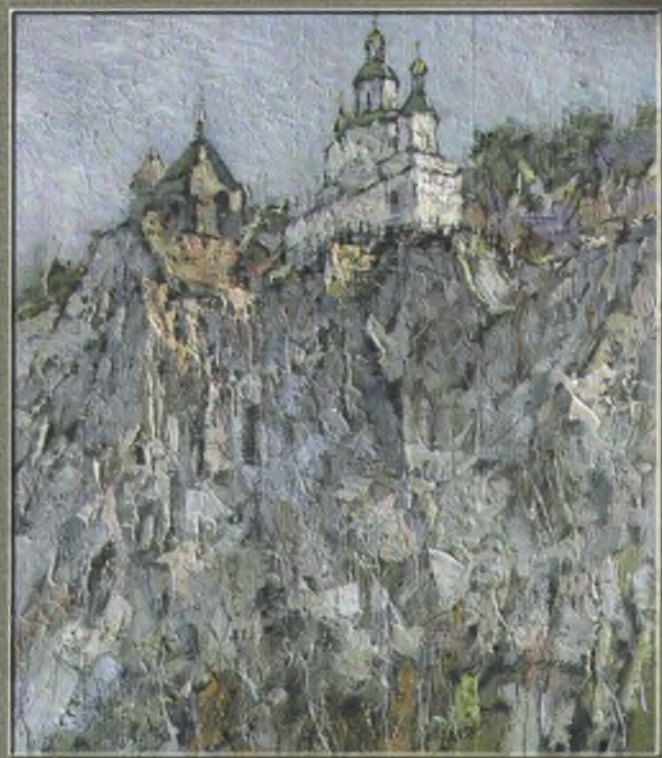
Савченко Ю.Г. Святогірський монастир, 2007. П., о. 60x50