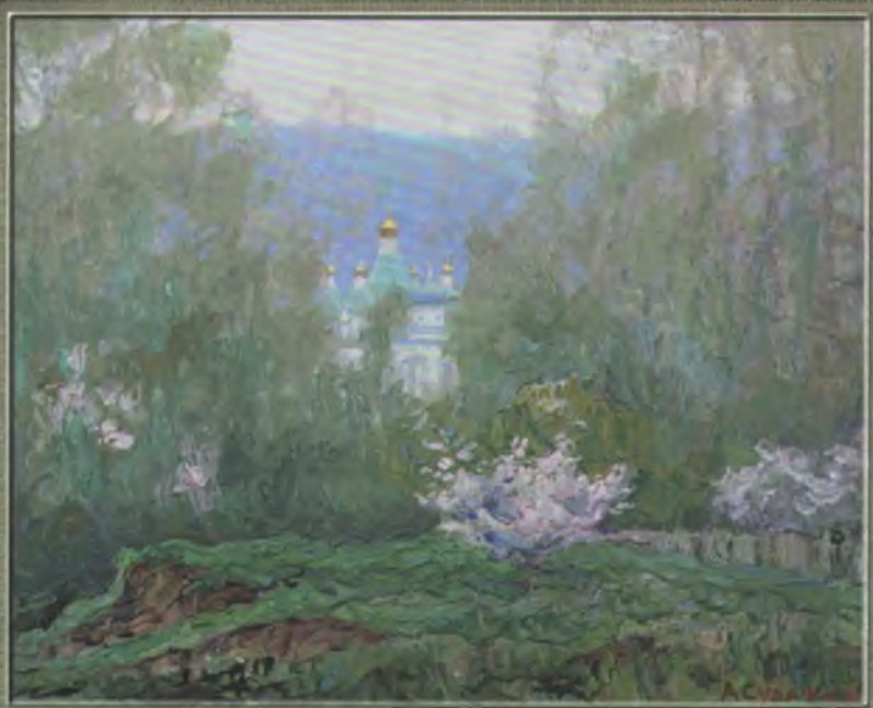
Судаков О.Л. З серії "Святогірська весна". Рожевий цвіт, 2007. К., темп. 22x29